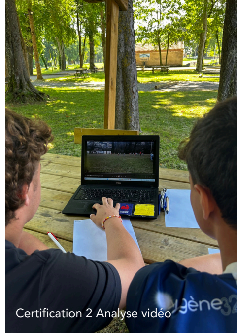
Certification 2 Analyse vidéo