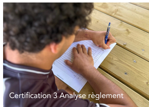
Certification 3 Analyse règlement

EPL d'Auch Beaulieu Lavacant Établissement agricole dans le Gers